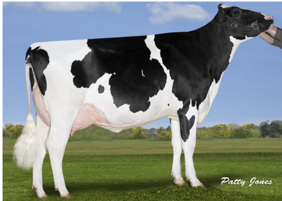
MAPEL WOOD CGAIN LOTTO P DAM

CALBRETT SIFTER P *RC MAPEL WOOD CGAIN LOTTO P VG-86-2YR-CAN 1* STANTONS CAPITAL GAIN MAPEL WOOD LADD LEAH P VG-86-2YR-CAN 5* TIGER-LILY LADD P-RED MAPEL WOOD M O M LUCY VG-86-2YR-CAN 9*