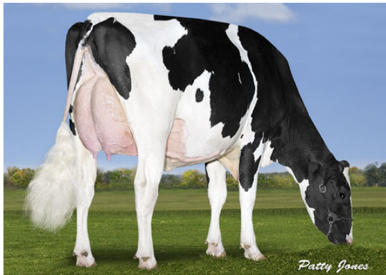
MAPEL WOOD CGAIN LOTTO P DAM